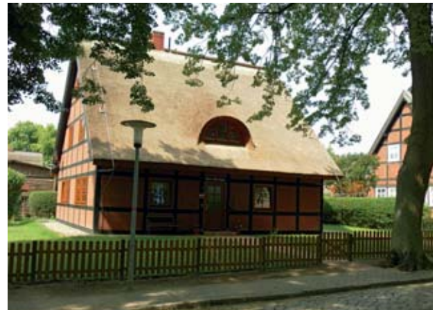
Abbildung 2 In der NS-Zeit errichtetes niederdeutsches Reedhaus (Musterhaus) im Dorf Alt Rehse.

Dies war das Thema des Frühjahrestreffens des Arbeitskreises Geschichte der Zahnheilkunde, das am 9. und 10. April 2011 in Alt Rehse und Neustrelitz in Mecklenburg-Vorpommern stattfand. In diesem landschaftlich reizvoll am Ufer des Tollensesees gelegenen Dorf befand sich in der Zeit des Nationalsozialismus der Sitz der „Führerschule der Deutschen Ärzteschaft“. In dieser zentralen Schulungsstätte des „Nationalsozialistischen Deutschen Ärztebundes“ (NSDÄB) erfolgten von 1935 bis 1943 weltanschauliche und „rassenhygienische“ Schulungen von Ärzten, Zahnärzten, Apothekern und Hebammen aus dem gesamten Deutschen Reich. Das seit 2005 frei zugängliche Gelände wird von der Vereinigung „Tollense Lebenspark“ genutzt. Lediglich ein schlichter Gedenkstein erinnert an die Historie dieser Stätte (Abb. 1). Im Gutshaus von