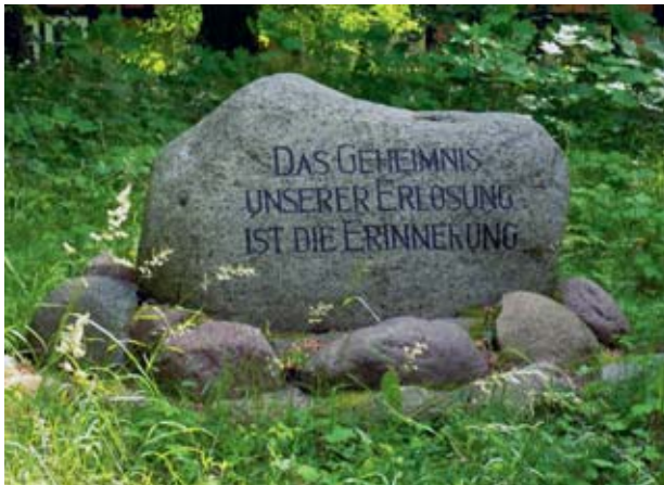
Abbildung 1 Gedenkstein auf dem Gelände der ehemaligen „Ärztzuführenschule“ Alt Rehse.