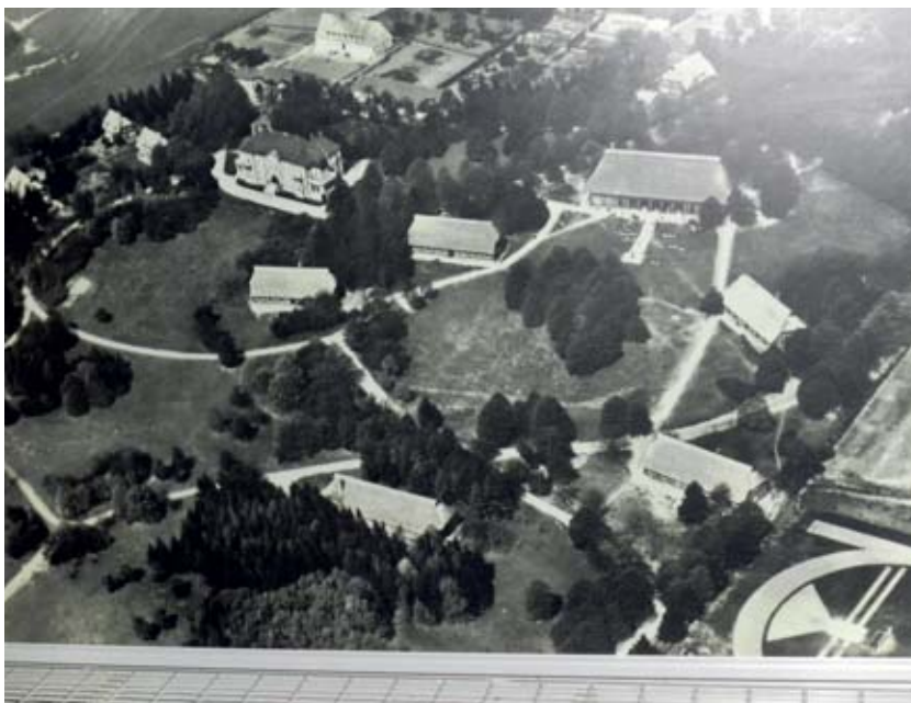
Abbildung 3 Luftaufnahme der „ÄrztEFührerschule“ 1937. Links oben: das Herrenhaus; rechts oben: das Gemeinschaftsgebäude mit beiderseits je zwei Unterkunftshäusern und einem Appellhofplatz davor.

10.000 Heilberufler wurden innerhalb von 8 Jahren in der „ÄrztEFührerschule“ geschult; darunter waren auch ausländische Teilnehmer bzw. Gäste aus 20 Ländern.