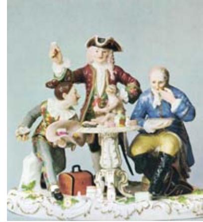
Abbildung 2 Johannes Joachim Kändler, Meißen 1706–1775, Der Zahnbrecher.