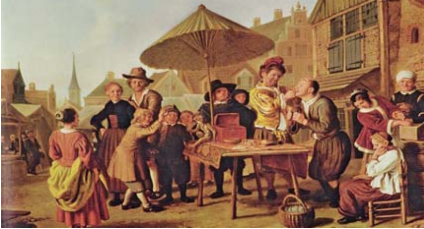
Abbildung 1 Jan Victors, Amsterdam, 1620 bis um 1676, Der Zahnreißer.