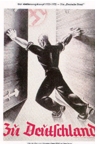
Abbildung 1 Plakat der „Deutschen Front“ des Saargebietes von 1934 (Die „Deutsche Front“ des Saargebietes war eine nach außen propagierte überparteiliche Bewegung, die vollständig unter der Kontrolle der NSDAP stand, und die sich für die Rückgliederung des Saargebietes in das nationalsozialistische Deutschland einsetzte.)

Nach 1945 bestanden in den Bundesländern die Strukturen innerhalb des Gesundheitswesens vom Grundsatz her weiter. Die am Anfang beschriebene Rolle der Ärzte und Zahnärzte wurde im Saarland ab 1947 zusätzlich von der besonderen Staatsform, der von Frankreich abhängigen „Autonomie“, und von den Auseinandersetzungen während der Volksabstimmung zum „Europäischen Saarstatut“ im Jahr 1955 beeinflusst. Dabei stand das Saarland 1955 – wie auch schon das Saargebiet 1935 – im Spannungsfeld der europäischen Politik. In der Anfangszeit des „autonomen“ Saarlandes versuchten viele demokratisch orientierte und unbelastete Ärzte und Zahnärzte die Strukturen der NS-Diktatur, die teilweise immer noch ihre Berufsausübung bestimmten, zu reformieren und abzuschaffen. Dies wurde ihnen aber von der Regierung des Saarlandes aus machtpolitischem Interesse und