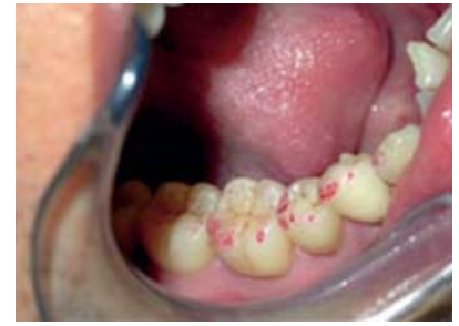
Abbildung 2 Dentale Oberflächenuntersuchungen unter klinischen Bedingungen.