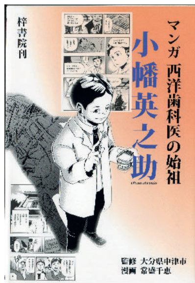
Abbildung 1 Cover des Obata-Mangas.

Dass der Manga darauf nicht eingeht, liegt möglicherweise daran, dass