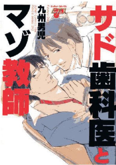
Abbildung 3 Cover des Sado-Zahnarzt-Mangas.