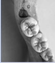
Abb. 3: Weisheitszahn des Unterkiefers im Zahnfach hinter dem zweiten Backenzahn.