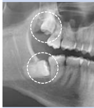
Abb. 1: Im Knochen retinierte Weisheitszähne im Ober- und Unterkiefer. Die Krone des Weisheitszahnes liegt hier unmittelbar am zweiten Backenzahn. Der Zahnhalteapparat des benachbarten Zahnes wird so auf Dauer erheblich geschädigt.

Da dieses Problem bis zu 80 % der jungen Erwachsenen in der europäischen Bevölkerung betrifft, müssen sich die meisten Menschen früher oder später mit der Frage der Zahnentfernung auseinandersetzen. Aus diesem Grunde haben wir diese Informationen für Sie zusammengestellt.